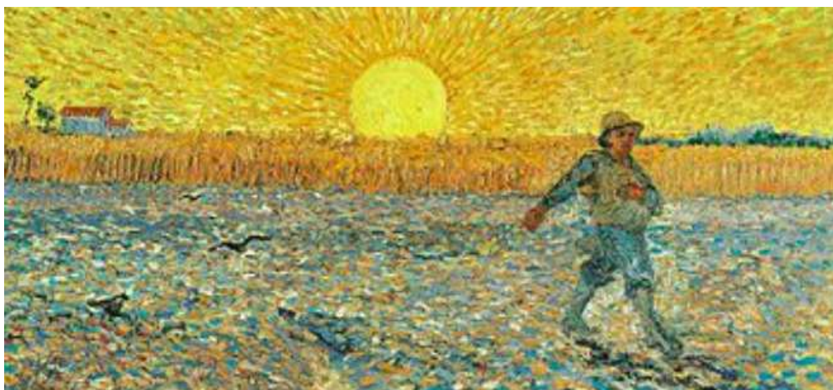
«Il seminatore uscì a seminare» (triennio 2014-2017)

A tutti l'augurio di una buona preghiera e di un buon lavoro!